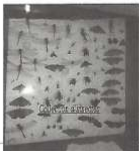
Colle de différents