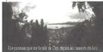
Vue panoramique sur le site de Cap devant le lac de la Lac

Le Parc Naturel Jacques Lajoie est à vocation éducative, environnementale, culturelle, sociale, et écotouristique. Le site accueille hebdomadairement des conférences et des ateliers sur l'environnement. L'espace est aussi accessible à tous les groupes de la communauté capoise voulant y organiser une activité éducative, culturelle, également à toutes les familles, touristes, et autres qui veulent profiter d'un moment de recueillement en pleine nature..