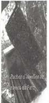
Chalet d'accueil au niveau du Parc

Méthode de culture: Lieu de culture: Date de collecte: 5 avril 2012