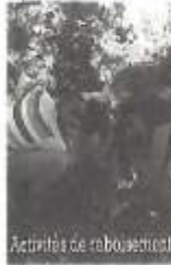
Activités de reboisement