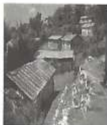
Construction anarchique au niveau du Morne Lory

L'installation des occupants dans l'aire du Morne Lory altère son intégrité, augmente la vulnérabilité de l'espace et menace les enjeux écologiques, économiques, socioculturels et esthétiques de la ville du Cap-Haïtien.