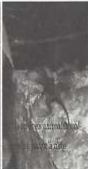
70 espèces animales collectées jusqu'à date