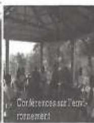
Carrières sur l'environnement