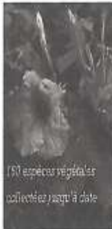
150 espèces végétales collectées jusqu'à date

L'écosystème du Parc renferme une biodiversité impressionnante. Les élèves du Groupe Environnemental du CNDPS ont identifié, inventorié, collecté, et classifié plus de 150 espèces végétales et 70 espèces animales (insectes, oiseaux, reptiles...).